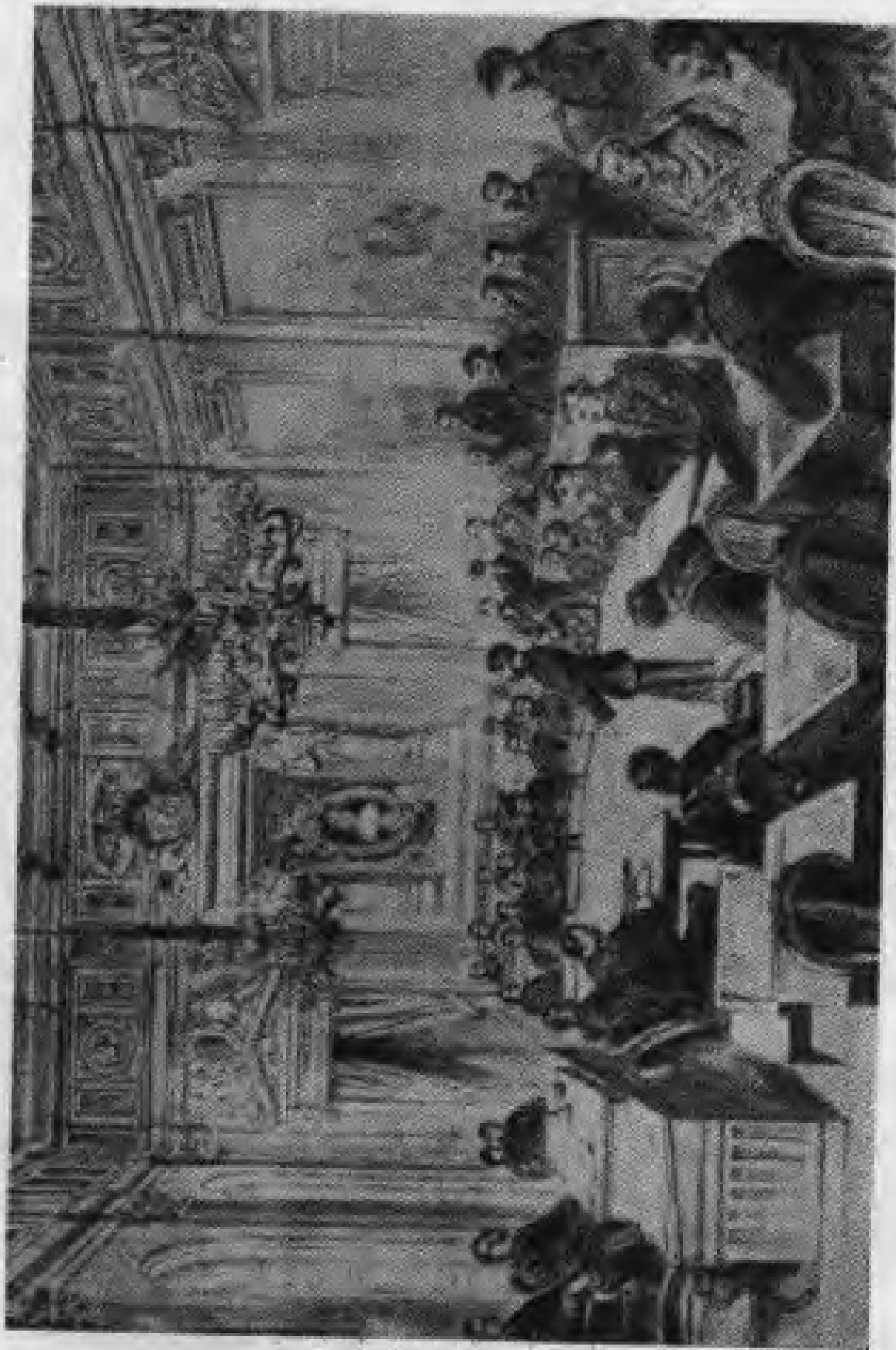
图 1. 在市歌厅大厅举行的巴黎公社会议