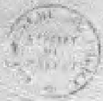
图6. 治安委员会关于查情《巴黎报》的命令